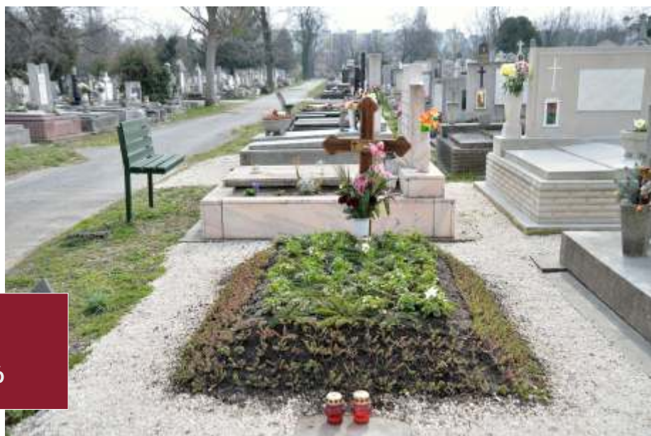
Török Gyula 32-12-15/16 olimpiai bajnok ökölvívó