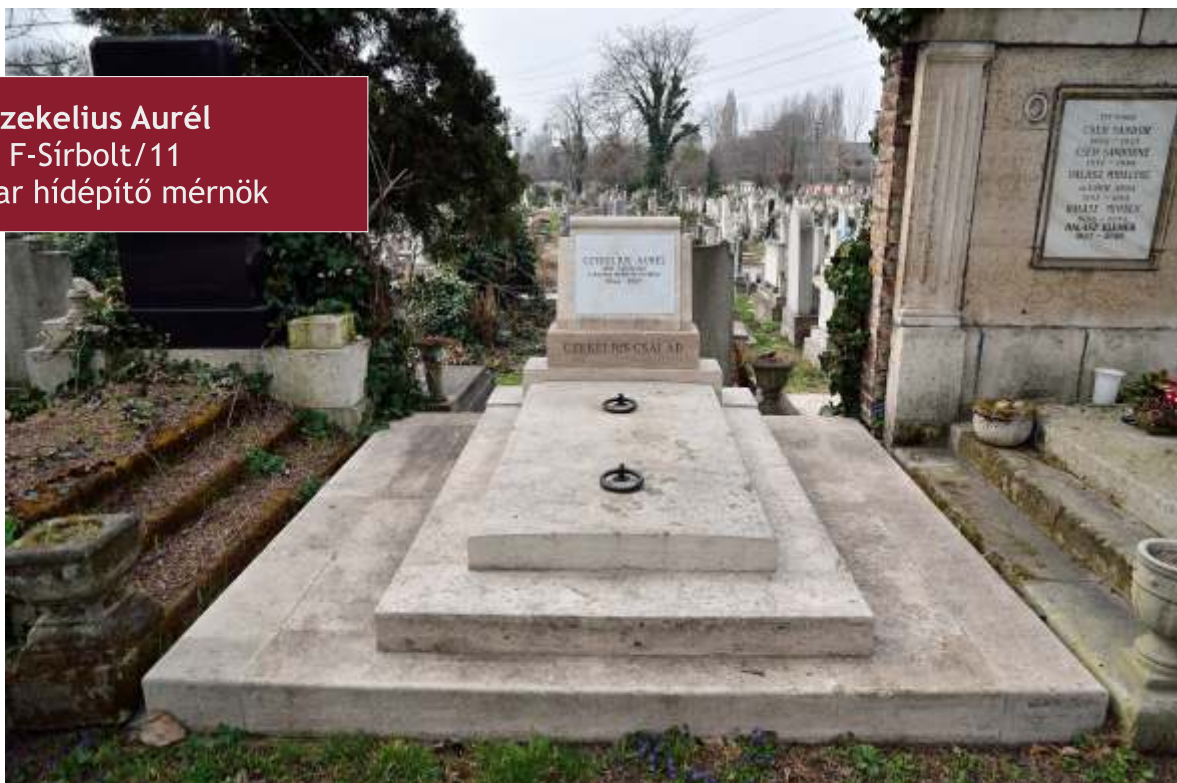
Czekelius Aurél F-Sírbolt/11 Magyar hídépítő mérnök

1850-1900 CEKELIUS AUREL 1850-1900 MAGYAR HÍDÉPÍTŐ MÉRŐK 1850-1900 MAGYAR HÍDÉPÍTŐ MÉRŐK 1850-1900